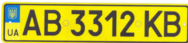
Рисунок А.1. Знаки типу 1