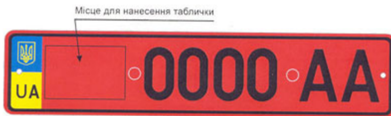
Рисунок А.2. Знак типу 2