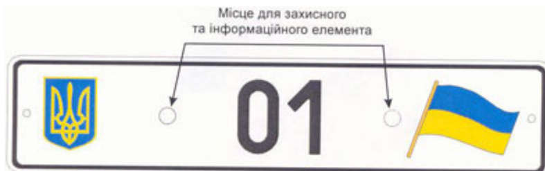
Рисунок А.3. Знак типу 3