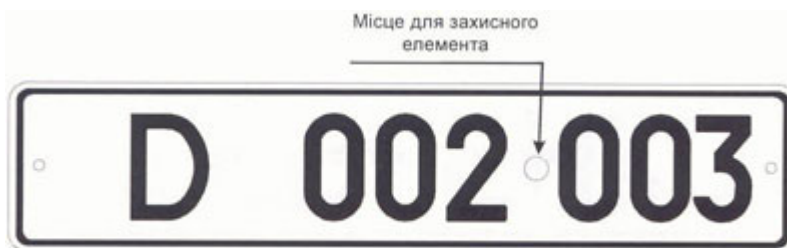
Рисунок А.4. Знак типу 4